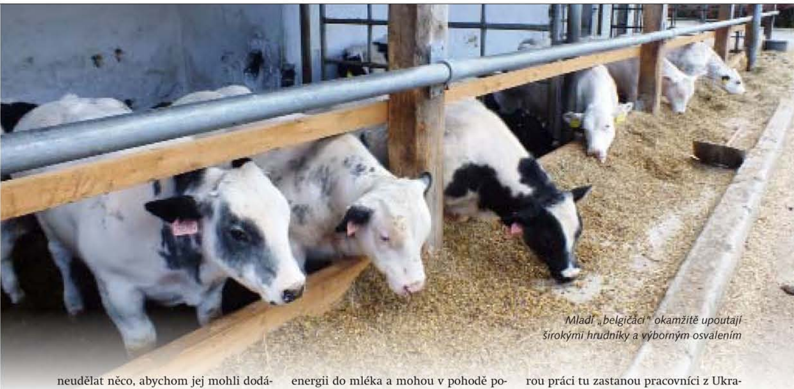
Mladí „belgičáci“ okamžitě upoutají širokými hrudníky a výborným osvalením

na mléce a vysoce kvalitním starteru. Proč se vlastně v Pojedech, které vešly do povědomí veřejnosti především chovem pestré palety francouzských masných plemen skotu, najednou rozhodli pro „belgičáky“? Inu, finančně se jedná o velice zajímavou záležitost. Samozřejmě nesmíte počítat s tím, že vám tohle maso dokáže zaplatit někdo v Česku, ale musíte si zajistit odbyt „venku“. V tomto případě byly navázány kontakty přímo v Belgii a Nizozemsku, kde je maso z belgického modro-bílého skotu vyhledávanou a patřičně oceněnou surovinou, takže cena kvalitního jatečného kusu se pohybuje kolem 3,5 tisíce euro. Jenže to zas nemůžete přivést jeden kus na přívěsu za osobákem. Jatečných zvířat musíte dokázat dodat najednou celý kamion, a pak to může fungovat. Proto je stav belgických matek v Pojedech plánován na přibližně 200 ks. S takovým plánem přišla i další myšlenka: když už budeme potřebovat mléko pro telata, což nám masné stádo zajistit nedokáže, tak proč