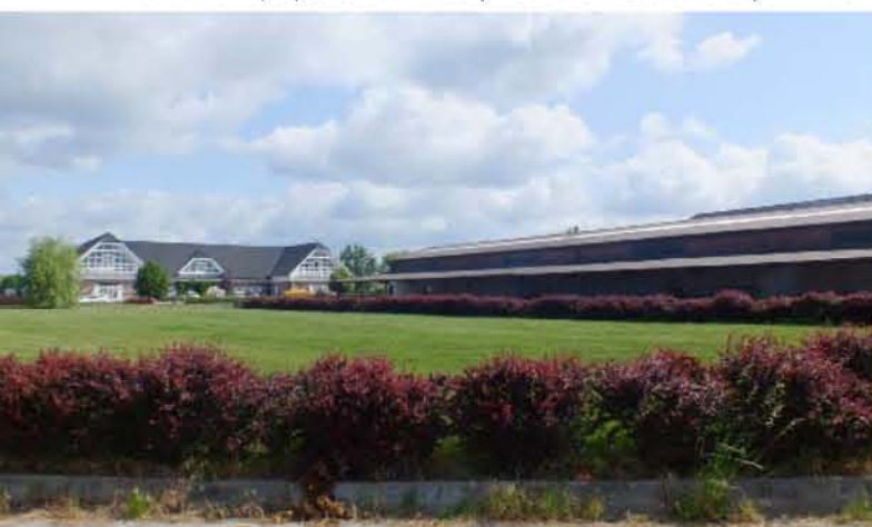
Na Farmě Pojedy se snoubí krása prostředí s krásou chovaných zvířat Spokojené belgické matky-dárkyně na pastvině

Přejeme do dalšího konání šťastnou ruku při výběru lidí a technologií a těšíme se na pozvání k další návštěvě. Určitě zase budeme příjemně překvapeni mnoha novinkami. Tady opravdu nejsou zvyklí spát na vavřínech, i když počítají s tím, že si z Národní výstavy masného skotu v Brně nějaké domů přivezou. |