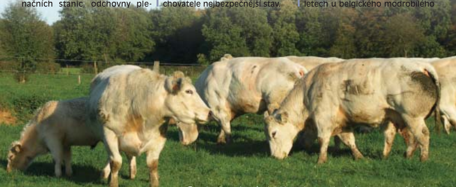
□ Na farmě D'Izier zůstává část telat s matkami

Pomaloučku se začínalo šerit, ale nás čekala ještě jedna farma, a tou byl chov Du Fond de Bois pana Monforta, kde jsme měli možnost důkladněji nahlédnout do způsobu odchovu telat a mladého dobytka, který se zde velmi podobá intenzivnímu odchovu známému z chovů dojených plemen. Telata jsou krátce po narození oddělena od matek a napájena nejprve mlezivem a poté mléčnou náhražkou. Zhruba po dvou týdnech jim začne chovatel přidávat koncentrovanou krmnou směs (starter). Ustájení mladých telat tu bylo organizováno pro nás dost netradičním způsobem – ve stáji byly jednotlivé kotce vymezeny jednotlivými balíky slámy. Padl i dotaz na mortalitu telat, která byla i v některých českých chovech dost velkým problémem. Tady si chovatel velmi chválil informace o výskytu letálních faktorů, které byly v posledních letech u belgického modrobílého