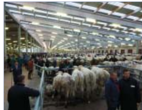
□ Pohled do velké haly tržnice v Ciney

Část našeho programu byla věnována i návštěvě tržnice, kde se prodává skot určený pro výkrm nebo na porážku. Město Ciney má v pořádání trhů hospodářských zvířat dlouholetou tradici – už od osmého století se zde scházeli chovatelé, aby svá zvířata nabídli kupcům a téměř dvě třetiny zvířat, která jsou nabízena k prodeji na veřejných trzích, jsou zobchodovány právě na trhu v Ciney. Dvoukřídlá budova tržnice s prostorem cca 16 tisíc metrů čtverečních, 88 rampami pro vykládku