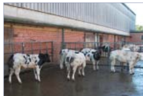
□ Mladí býčci na odchovně v Ciney

Chov je řízen tak, aby se věk při prvním otelení pohyboval kolem 25 měsíců a od každé krávy je snaha získat 2–4 telata. Po druhém teletí chovatel krávy selektuje – nejhorší jsou dokrmeny na jatka, průměrné jsou ještě jednou zapuštěny (na jatka jdou po třetím teletí, kdy se na jatkách dostane ještě velmi dobrá cena) a od nej-