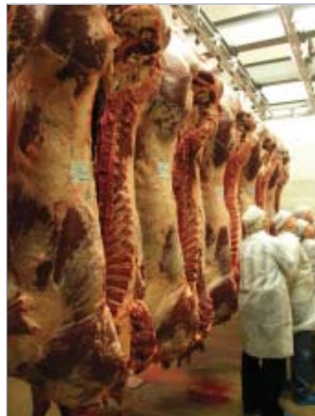
□ Jatečná těla belgických modrobílých býků na jatkách v Ciney

Jak praví parafráze starého židovského vtipu: Mezi prodejem za 1,5 eura nebo za 3 eura je „jen“ jedenapůl eura rozdíl. Nám se ale ten rozdíl zdál více než znatelný. Dostávat za srovnatelné zboží polovic než jinde na „jednotném“ evropském trhu vypadá jako poněkud diskriminující – zejména, když si uvědomíme velikost do-