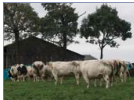
□ Na farmě De la Béole jsou krávy chovány na pastvě

Telata po narození odděluje od matek (přičemž se snaží, aby byla napojena mlezivem od vlastních matek). Mlezivo k napojení telat používá jak od belgičanek, tak od holštýnek – má zamraženou zásobu, aby v případě potřeby mohl tele bez problémů včas mlezivem napojit.