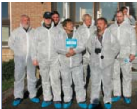
□ Skupina cestovatelů před odchovnou belgických modrobílých plemenných býků

Do tří týdnů jsou telata umístěna v individuálních kotcích a pak jdou do skupin. Telata jsou do věku 58 dní napájena 2x denně po 2 litrech mléka (cca po týdnu je jim nabídnut starter), pak začnou dostávat 4 litry mléka jednou denně, a když telata přijímají starter, tak množství mléka postupně snižuje. Jakmile telata spotřebují 3 kg starteru, jsou odstavena.