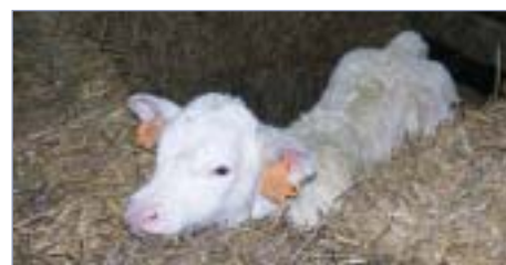
□ V chovu Du Fond de Bois jsou telata po narození umístěna v „slaměných kotcích“