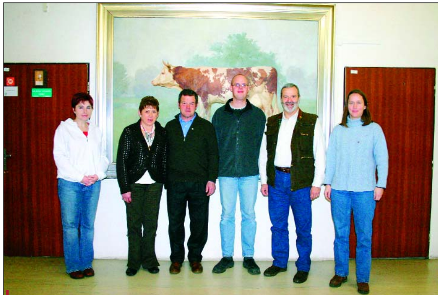
Delegace pracovníků plemenné knihy navštívila i VÚŽV Uhřetěves

V Belgii byla vakcinace nepovinná. Ministerstvo se však před pěti lety rozhodlo, že do programu kontroly IBR vstoupí. Podle monitoringu je v populaci 66 % IBR pozitivních zvířat (číslo zahrnuje jak vakcinované, tak nakažené kusy). Ozdravovací program, který je podporován státem, je stále dobrovolný, nebo spíše částečně povinný. Od léta 2006 však musí být všechna zvířata, která se účastní výstav, IBR negativní. Nyní je více než evidentní, že pokud se program nestane povinným, nastane nikdy výraznější obrat. Již v tomto roce (2007) by se proto mělo začít s celorepublikovým ozdravováním, náklady budou asi 16 eur na zvíře a rok.