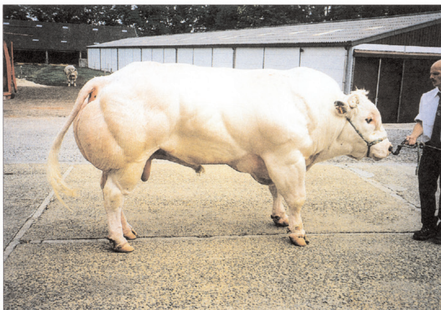
Belgické modré, býk, stáří 6 let, hmotnost 1200 kg (HALIBA-VRV)